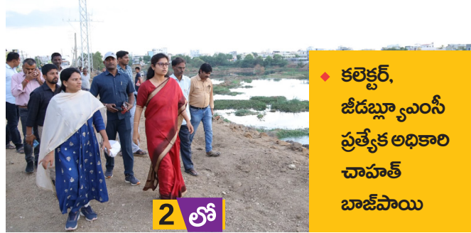
కలెక్టర్, జీడబ్ల్యూఎంసీ ప్రత్యేక అధికారి చాహాట్ బాజీపాయి