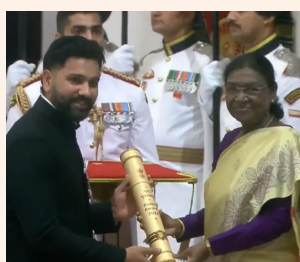
నరేంద్ర మోడీ, కేంద్ర హోంమంత్రి అమిత్ షా, మాజీ రాష్ట్రపతి రామనాథ్ కోవింద్, కేంద్రమంత్రులు రామ్మోహన్ నాయుడు, పీయూష్ గోయల్, ధర్మేంద్ర ప్రధాన్, గణేంద్ర సింగ్ షెఖావత్ తదితరులు పాల్గొన్నారు.

రాలను అందుకున్నవారిలో సీని నటులు మాగంటి మురళీ మోహన్, రాజేంద్రప్రసాద్ ఉన్నారు. అలాగే, వీరితో పాటు సీని నటుడు మాధవన్, క్రికెటర్ రోహిత్ శర్మ, పలు రంగాలకు చెందిన ప్రముఖులు ఈ పురస్కారాలను అందుకున్నారు. దేశంలోని పలు రంగాల్లో విశేష సేవలందించిన వారికి భారత గణతంత్ర దినోత్సవం వేళ కేంద్రం మొత్తం 131 మందికి పద్మ పురస్కారాలకు ఎంపిక చేసిన విషయం తెలిసిందే. తొలి విడతలో 66 మందికి అందజేయగా.. మిగతా వారికి నేడు ప్రదానం చేశారు. ఈ కార్యక్రమంలో ఉపరాష్ట్రపతి సీపీ రాధాకృష్ణన్, లోక్ సభ స్పీకర్ ఓం బిర్లా, ప్రధాని